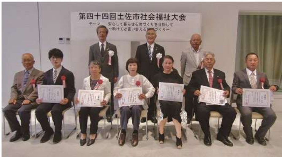
表彰された皆さん

令和 4 年 3 月に予定されていた第 44 回土佐市社会福祉大会は、新型コロナウイルスの感染拡大を受け中止となりましたが、規模を縮小して実施した表彰式典で表彰された皆さまをご紹介します。