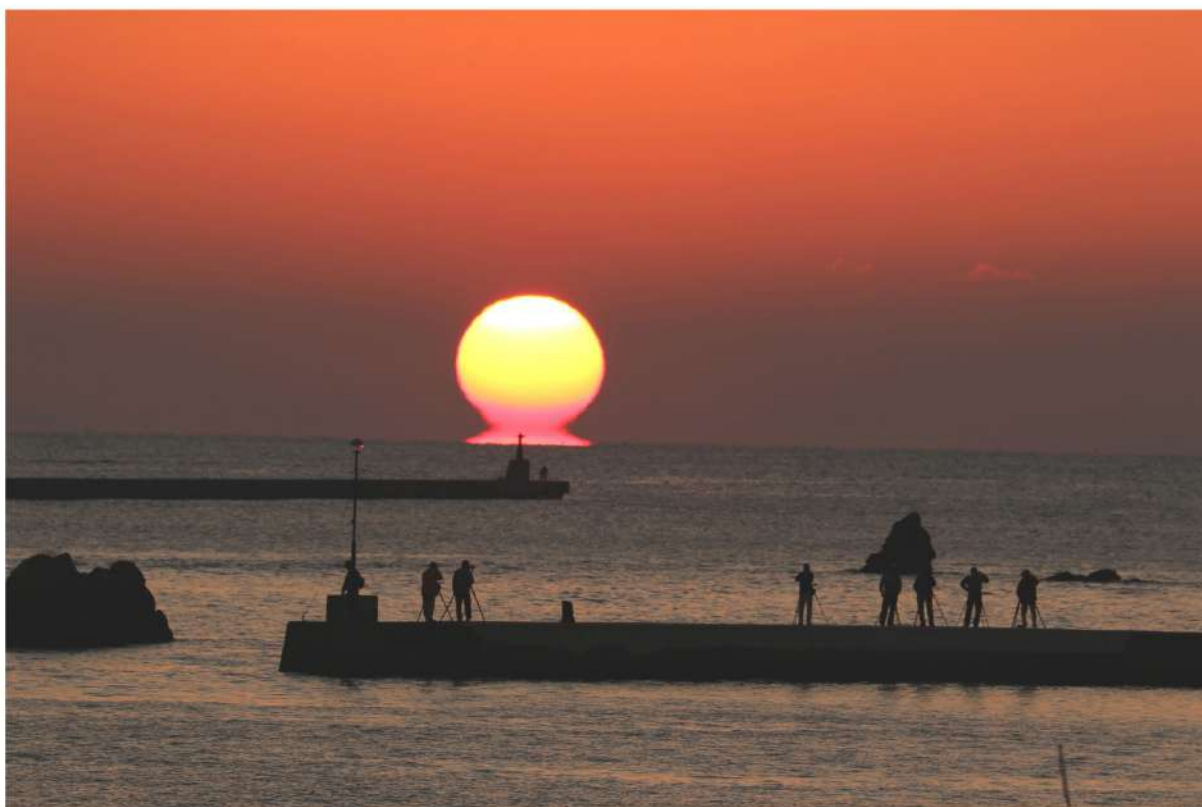
撮影者：福岡 照男 氏（「写真で土佐市をPR！フォトコンテスト2019」入賞作品）