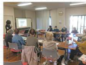
蓮池サテライト 高知赤十字ミニ講座「栄養について」