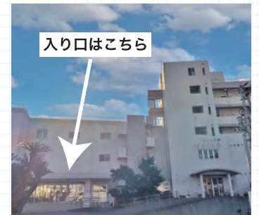
あったかさくら貝