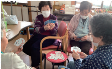
トランプ「ババ抜き」