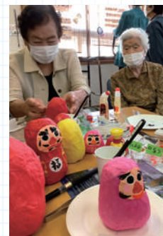
市民展へ出展 七転八起だるまづくり