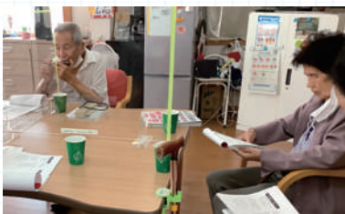
ハーモニカに合わせてみんなで合唱♪