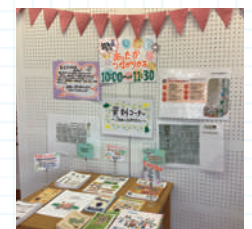
さまざまな情報コーナーもあります!

認知症について理解を深め、たとえ認知症になっても、お住まいの地域でいつまでも暮らしていくことができるよう、「情報提供」、「交流」、「集い」の場を目指しています。