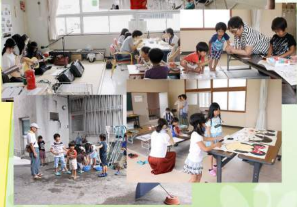
7月は昔遊びの体験もして子供達は楽しそうに遊んでました。

地域の子どもの居場所となれるように、ボランティアさんのご協力のもと活動をしています。 只今、地域住民の方や、サンプルラザさんに食材提供を頂き「ムックくん食堂」は運営しています。 この活動に対し、一般財団法人高知県職員互助会様・ライオンズクラブ様・高知県共同募金会様より、ご寄付をいただきました。 貴重なこの財源は地域の子どものためにより活用させていただきます。ありがとうございました。