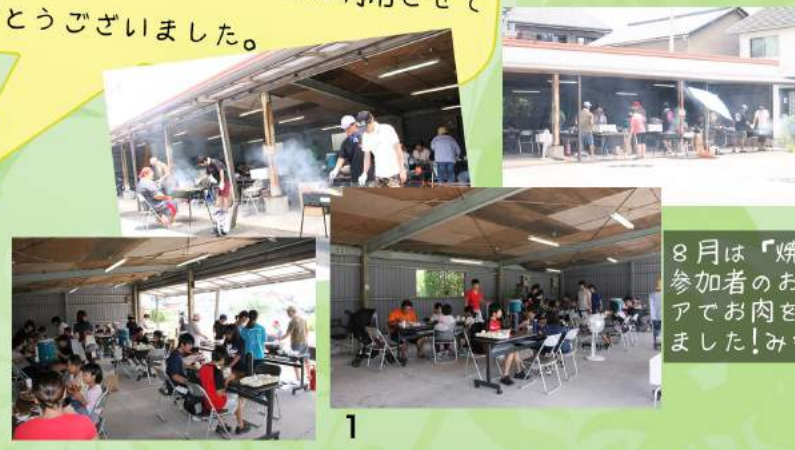
8月は「焼肉パーティー」でした。参加者のお父さん方がボランティアでお肉を焼くのを手伝ってくれました! みなさんお疲れ様でした。