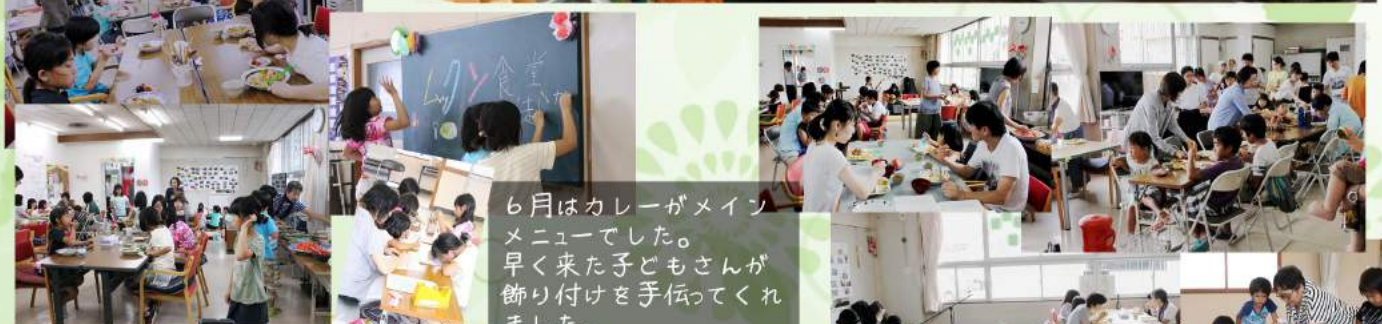
6月はカレーがメインメニューでした。早く来た子どもさんが飾り付けを手伝ってくれました。

地域の子どもの居場所となれるように、ボランティアさんのご協力のもと活動をしています。 只今、地域住民の方や、サンプルラザさんに食材提供を頂き「ムックくん食堂」は運営しています。 この活動に対し、一般財団法人高知県職員互助会様・ライオンズクラブ様・高知県共同募金会様より、ご寄付をいただきました。 貴重なこの財源は地域の子どものためにより活用させていただきます。ありがとうございました。