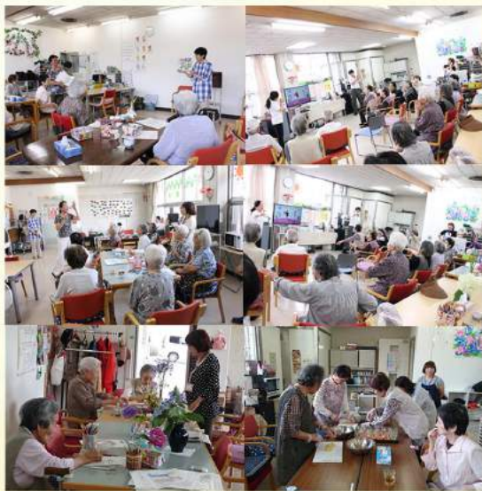
あったかふれあいセンター (高岡)

毎月色々な活動をしています。今回は、3B体操とデザート作りやボランティアさんによる絵本や紙芝居を披露してくれた時をピックアップしてみました。