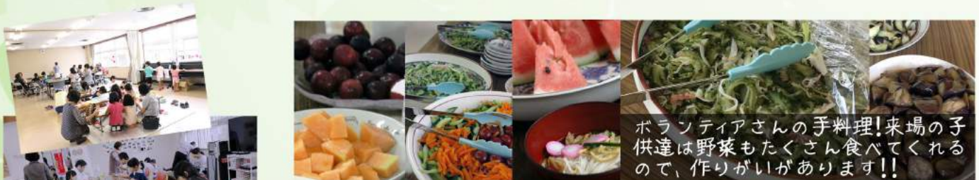
ボランティアさんの手料理! 来場の子供達は野菜もたくさん食べてくれるので、作りがいがあります!!

第4土曜日に開催されている「ムックくん食堂」この夏も元気に開催しました。多くの方が参加していただいているこの食堂は、土佐市の方々に子ども食堂を知っていただくために始まりました。食堂の利用者さんから「ここに来ようになってから料理のレシピが増えました。」や「子どもが野菜を食べられるようになりました。」など嬉しい言葉を頂けることが増えました。